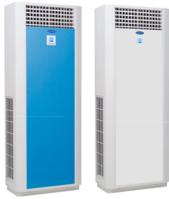
▲ 40QBY Series

The latest innovation from the world leader in air conditioning, Carrier, introduces the all-new floor standing split air conditioning system. The 40QBY millennium design, inside and out, will provide you with cool comfort via a variety of control functions.