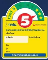
มาตรฐานรุ่น FTKZ4V2S