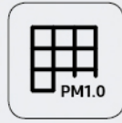
PM1.0 filter system