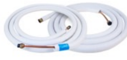
ท่อทองแดง