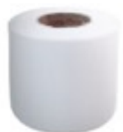
เทปพันสายไฟ