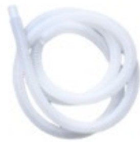
ท่อน้ำทิ้ง