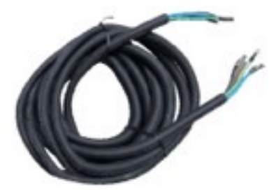
สายไฟขนาดยาว 4.3 เมตร